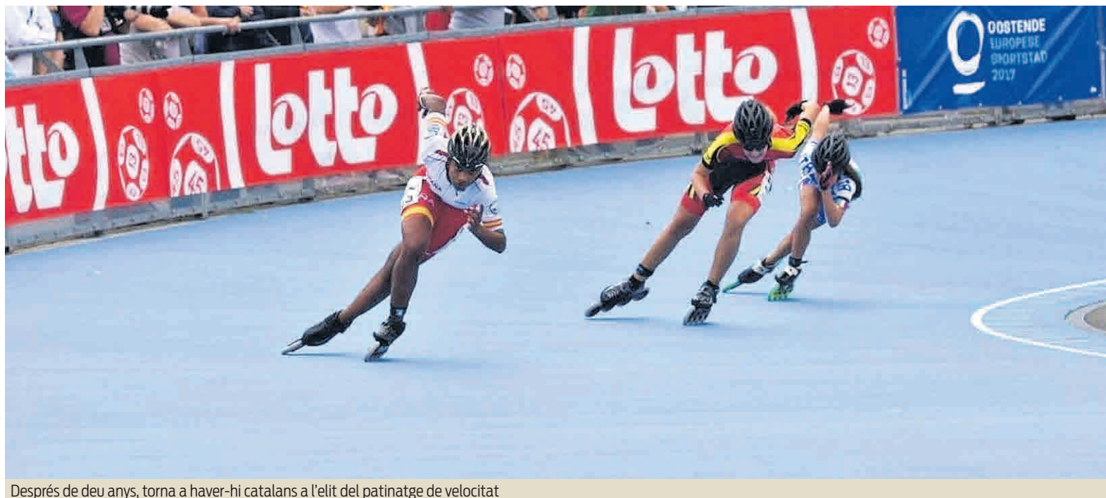
Després de deu anys, torna a haver-hi catalans a l'elit del patinatge de velocitat