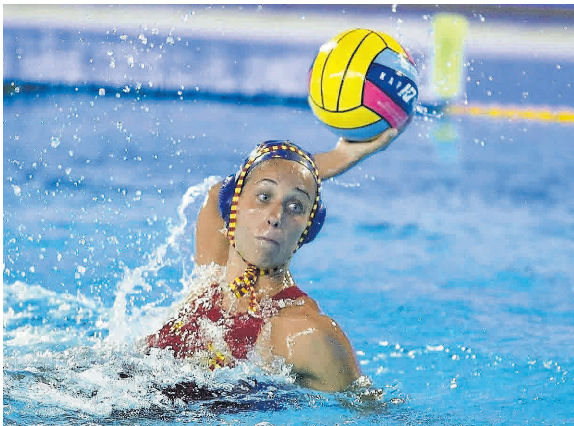
El cas del waterpolo català, un referent únic al món

Els èxits estatals d'hoquei patins i patinatge artístic estan fonamentats amb la participació dels catalans